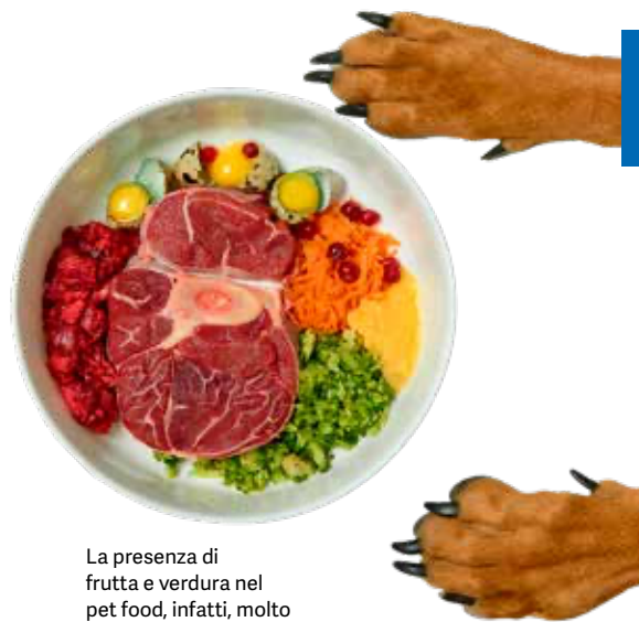
La presenza di frutta e verdura nel pet food, infatti, molto spesso consente ai produttori di dar vita a combinazioni di ingredienti che molto spesso richiamano alcuni accostamenti tipici della dieta umana

lizzati. Se infatti inizialmente questi cibi erano stati accolti con qualche scetticismo, rappresentando per la maggior parte una scommessa da parte di pochi produttori, oggi si sono definitivamente consolidati. Una buona parte della clientela sensibile all'offerta superpremium, non disdegna infatti di alternare occasionalmente la tradizionale dieta a base di carne con mangimi realizzati interamente con materie prime botaniche. La necessità sempre più forte per l'industria di individuare materie prime sostenibili e alternative alle proteine animali costituisce inoltre un fattore che porterà alla definitiva consacrazione di questi articoli.